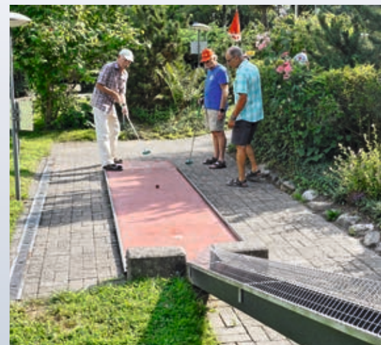
Minigolfspiel auf der Anlage Waldau

Text und Fotos: Roger Schneider Präsident des Ehrenkollegiums