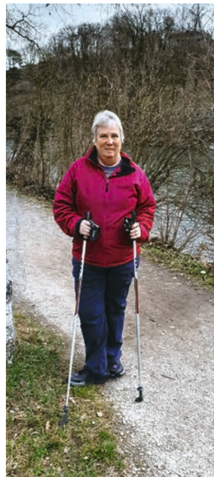
Mireille Chaignat