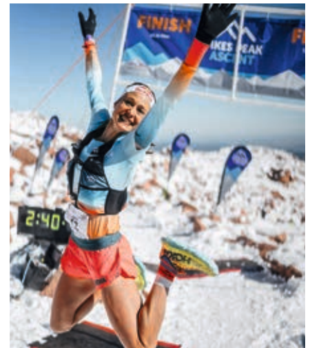
Freudensprung am Ziel

Nur eine Woche später, die 6. Etappe am Mammoth Trail, 30 km südöstlich des Yosemite-Nationalparks. Judith hat sich glänzend aufgefangen, läuft in einer Traum-Landschaft zum zweiten Etappen-Sieg und zu wichtigen 200 Punkten. Ihre grösste Rivalin, Sophia