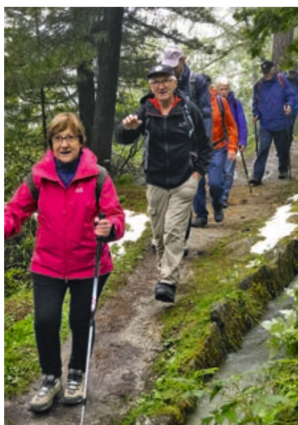
Entlang der Suone Bodmerwasser (Länge 2.7 km)

Ab Visp fuhren wir mit dem Bus das Tal hoch. Aus den Regentropfen wurden plötzlich grosse Schneeflocken, und so erreichten wir unser Hotel auf schneebedeckten Strassen. Der vorgesehene Ausflug auf die Bergstation Furggstalden mit anschließender Wanderung nach Saas-Almagell fiel buchstäblich in den Schnee. Alternativ besuchten wir die Kapelle Zermeiggen, in welcher der Opfer der Katastrophe von 1965 gedacht wird: Am 30.08.1965 stürzten riesige Massen Eis vom Allalingletscher auf das Arbeiter-Barackendorf etwas unterhalb der heutigen Staumauer. 88 Menschen kamen dabei ums Leben.