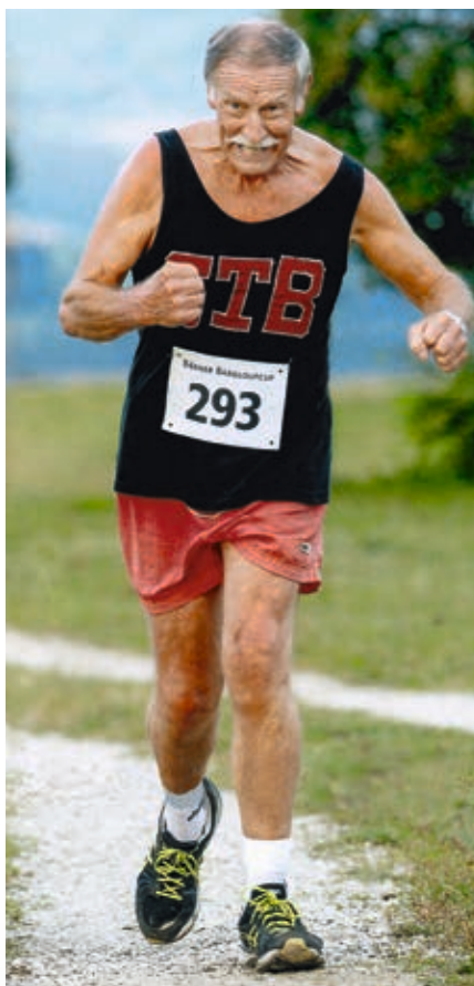
Teilnahme am Bärner Bärgloufcup 2014