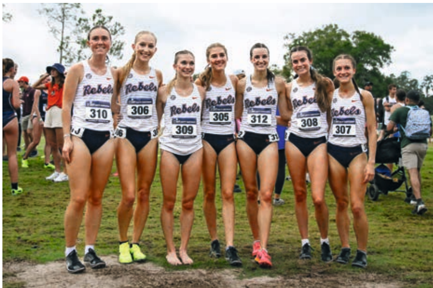
Unseres Team nach der Qualifikation für die Nationalmeisterschaften.

Jedes Team hat in den USA einen eigenen Namen: Wir sind die 'OleMiss Rebels'. Damit ist die 'alte' Miss, die Frau des Farmers auf den ursprünglichen Baumwoll-Farmen gemeint. Wir alle sind stolz für die 'OleMiss' zu starten. Bis zum Wettkampf-Start spielen wir immer wieder zusammen Karten oder gehen Kaffee trinken. Es wird immer viel gelacht, bis alle etwas nervöser und ernster werden vor dem Start. Der Cross selbst ist für uns Frauen 6 km lang. Für mich auf jeden Fall lang genug...! Wir hatten eine Super-Saison und haben es dieses Jahr an die Nationalmeisterschaften geschafft (die Top 30 Teams der USA qualifizieren sich). Die kurze Hallensaison musste ich leider verletzungsbedingt auslassen, konnte mich aber voll auf das Training konzentrieren.