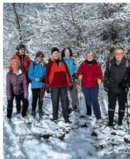
Verschneite Walking-Freu(n)de rund um Bern

Unsere Walkerinnen und Walker genossen den Berner Schnee bei strahlender Sonne.