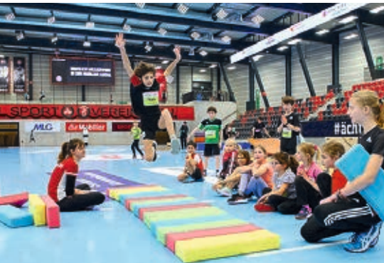
Voller Einsatz beim Sprung

Die Stiftung Jugendförderung SPORT FOR KIDS bietet sportbegeisterten Kindern zwischen 5-12 Jahren eine Plattform, verschiedene Sportarten kennenzulernen. So durften in der Saison 2023/24 rund 600 Kinder in den Sportarten Handball, Unihockey, Volleyball, Futsal, Fechten und Leichtathletik erste Erfahrungen sammeln. Bei diesen sechs Kids Days wurden die Kinder jeweils von prominenten Botschafter*innen aus den entsprechenden Sportarten begleitet. Die Stiftung Jugendförderung SPORT FOR KIDS hat es erfolgreich geschafft, die Neugierde der Kinder auf spielerische Art und Weise zu wecken.