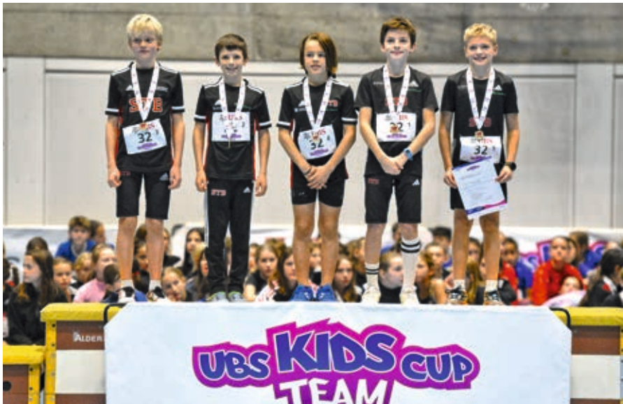
Das siegreiche U14-Team des STB in Bern.

In der Wintersaison 2023/24 fanden wieder die beliebten UBS Kids Cup Teams Vorausscheidungen statt. Der STB wurde auch dieses Jahr wieder von vielen jungen Athlet*innen vertreten. Unser Verein trat diese Saison an drei der möglichen Wettkämpfen an, um sich für den Regionalfinal am 10. März in Burgdorf zu qualifizieren. Und dies sehr erfolgreich.