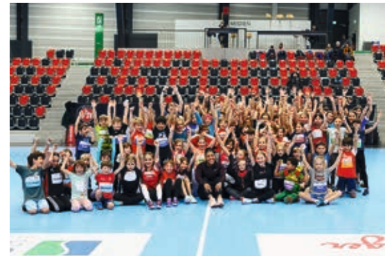
Die Teilnehmenden mit Mujinga Kambundji

Am Samstag, 13. Januar 2024 fanden sich in der Mobilar Arena in Gümligen knapp 100 Kinder zum ersten Kids Day Leichtathletik ein. Unter der fachkundigen Leitung der STB Nachwuchs-Trainer*innen wurden die Kids in die Grundformen der Leichtathletik (Lauf, Wurf, Sprung) eingeführt. Die Freude an der Bewegung und die Begeisterungsfähigkeit der Kinder war jederzeit spürbar. Der Höhepunkt des Events war ohne Zweifel der Besuch von Kids Day-Botschafterin Mujinga Kambundji. Sie stand den Kindern Red und Antwort und erfüllte unzählige Autogramm-Wünsche.