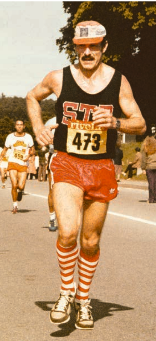
Unterwegs am Murtenlauf 1981

An der Ehrung für Verdienste im Sportbereich im September 2023 wurde in der Kategorie 'Herausragende Leistungen im Einzelsport' auch der 81-jährige Beat Marti aus dem Spiegel ausgezeichnet. Geehrt wurde er vom Könizer Gemeinderat für seine Erfolge sowie seinen unbedingten Durchhaltewillen im Laufsport.