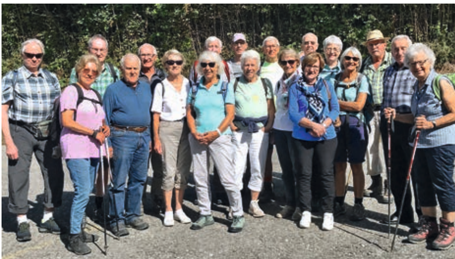
Legende: Gruppenfoto der Wandergruppe

Ennet der Saane wanderten wir über Hügel und entlang der Berner Biberen mit einem kurzen Blick in Freiburgs Himbeeren.