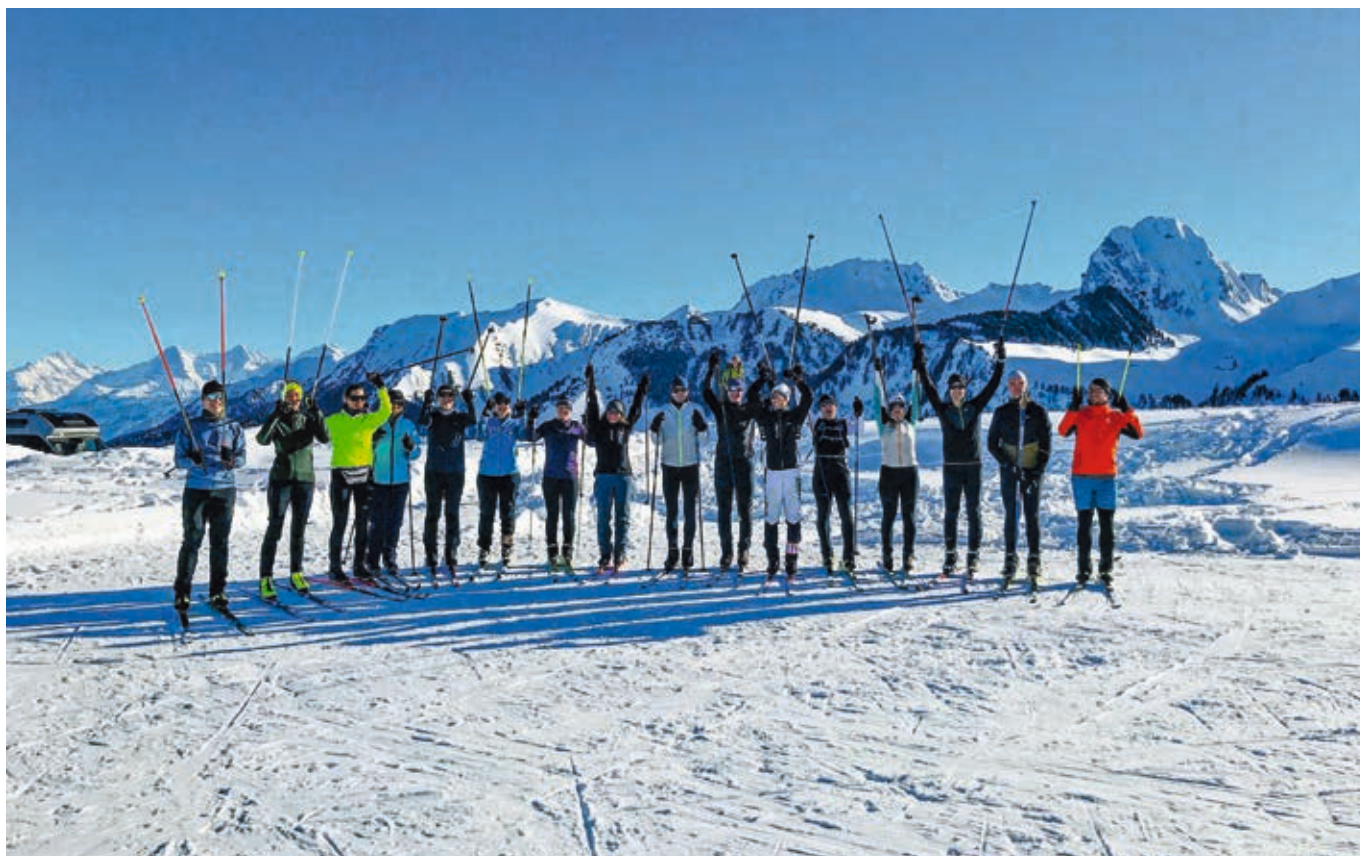
Hoch die Hände – STB-Winterwochenende

Das STB Langlauf- und Schneeschuh-Wochenende fand vom 12. bis 14. Januar im Gantrischgebiet statt. In Erinnerung blieben Tage voller gemeinsamem Sport und Genuss.