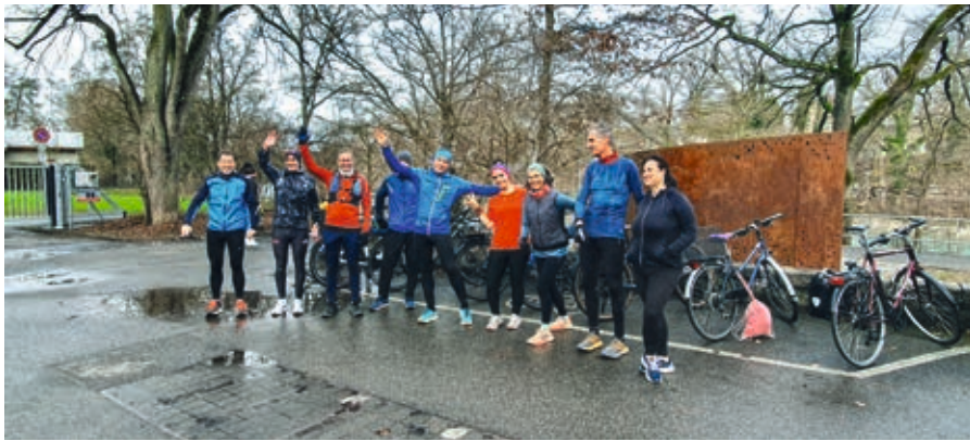
Bereits am 1. Januar trafen sich zahlreiche Teilnehmende der Challenge in der Schönau für einen gemeinsamen Lauf

Never stop running! Die Teilnehmenden der January Streak Challenge 2024 liefen jeden Tag im Januar mindestens eine Meile. Und profitierten dabei von neuen Erfahrungen, Disziplin und Kondition – und ganz viel Freude. Die Regeln sind klar und gleich wie in den letzten Jahren.