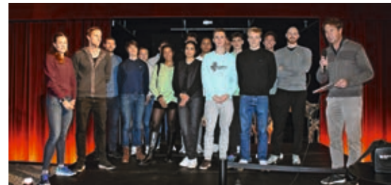
Präsentation der Förderathlet*innen