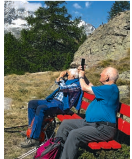
Die beiden Fern-Seher

Einzelne stiegen bei der Pflanzen- und Bergpracht wie einst im Mai über die Höhenkurven auf. Auf Kreuzboden genossen wir die Sicht auf die 4'000er-Bergwelt. Bei guter Sicht sind 18 4'000er-Bergspitzen zu bestaunen.