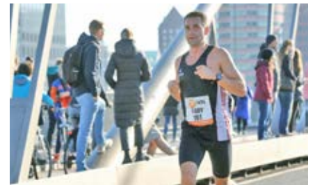
T-Roy an den US Olympic Trials in Orlando

Die Qualifikation für die Trials in Orlando (Florida) Anfang Februar war der verdiente Lohn für eine abgeklärte Leistung in Valencia.